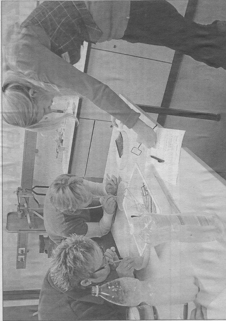
Mit verschiedenen Experimenten – beispielsweise zum Themenbereich „Wasser“ – konnten die Teilnehmer ihre Erfahrungen selbst sprachlich umsetzen.

Wegen der großen Akzeptanz der Fortbildungsveranstaltungen zur Sprachförderung (550 Teilnehmer aus dem ganzen Kreisgebiet bei den bisher vier Veranstaltungen) soll die Reihe fortgesetzt werden.