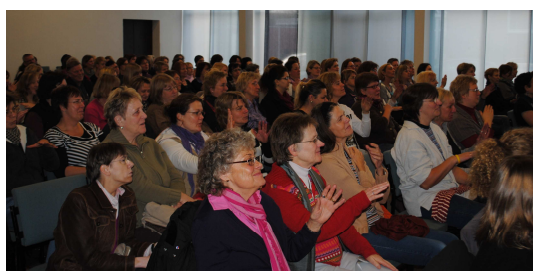
Großes Interesse an "Sprache und Musik" am 20.11.2010 in Warendorf