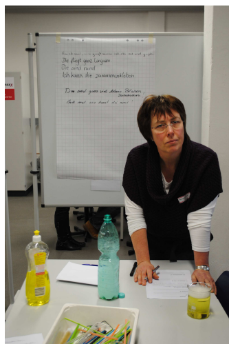
Praktisches Experimentieren und Reflexion über das Sprachverhalten von Kindern in den Workshops